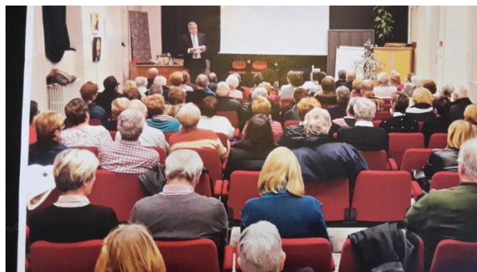
(Ci-dessus, la salle de Spectacles )

Répétition tous les Mercredi de 14 h à 18 H, dans notre Salle de spectacle