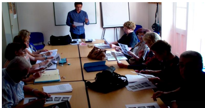
(Ci-dessus, une salle de Cours )

- Imaginer, raconter, partager avec "L'Atelier d'ECRITURE"