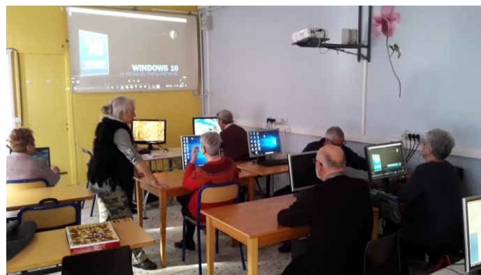
(Ci-dessus, la salle d' Informatique )

NB: les inscriptions au repas de l'Ecole hôtelière se font à partir de la parution du bulletin mensuel ET, A LA PERMANENCE.