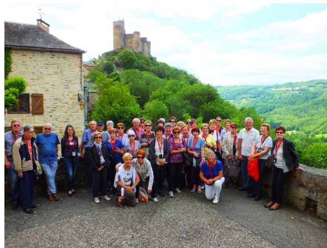
(En voyage artistique et culturel)

Pour de plus amples informations, venez nous voir à la permanence ou par téléphone au 04 67 90 17 09