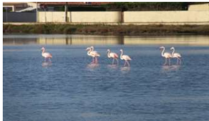
Le printemps arrive ... !!!