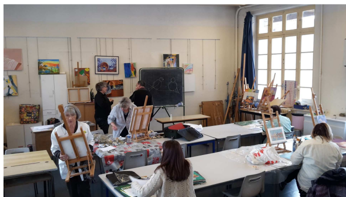
(Ci-dessus, la salle de PEINTURE )

ATELIER THEATRE : Répétition les Mercredi de 14 h à 18 H - Au Siège