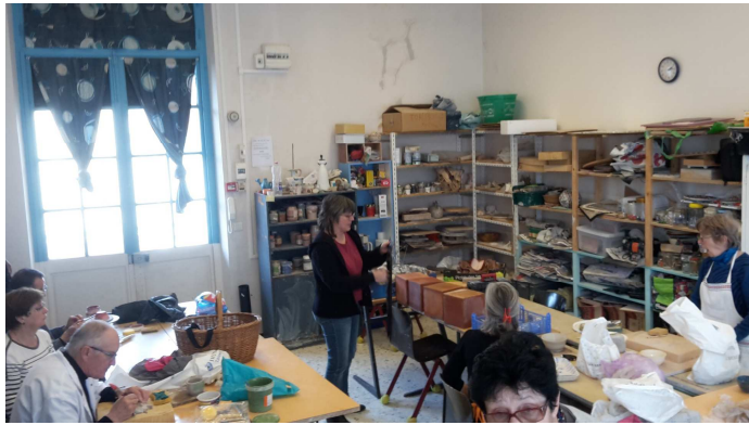
(Ci-dessus, la salle de POTERIE )