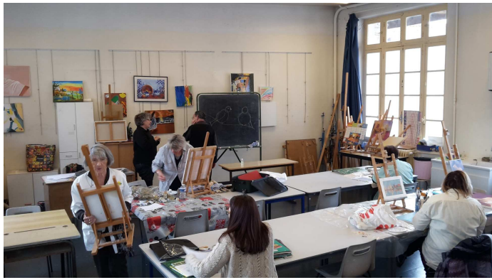
(Ci-dessus, la salle de PEINTURE )

la Botanique vous apprendra à reconnaître les plantes.